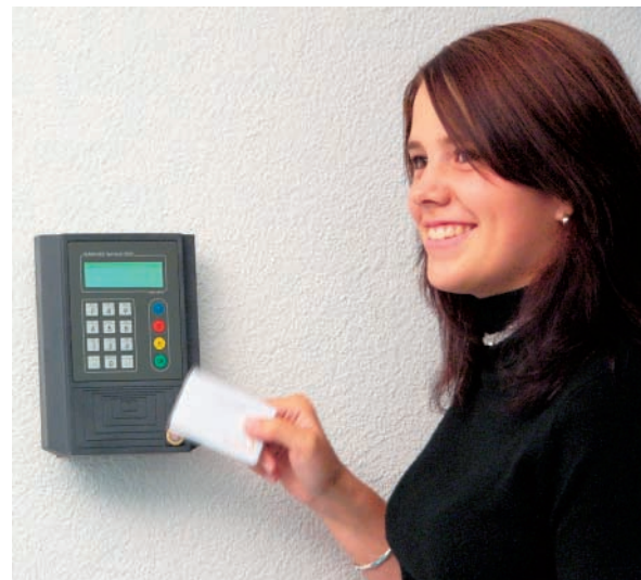
Berührungslose Zeiterfassung am ADMIA BDE Terminal 3000.